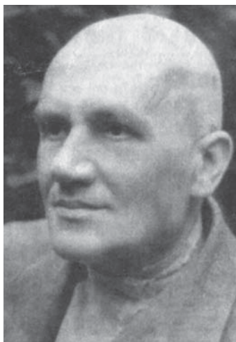
Проф. В. В. Рейхардт (1901 – 1949), декан экономического факультета, умер во время допросов