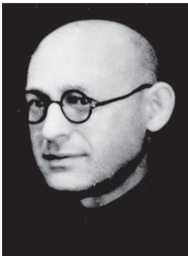
Проф. М. И. Бортник (1899–1976), подвергался преследованиям, вынужден был уехать в Ростов-на-Дону