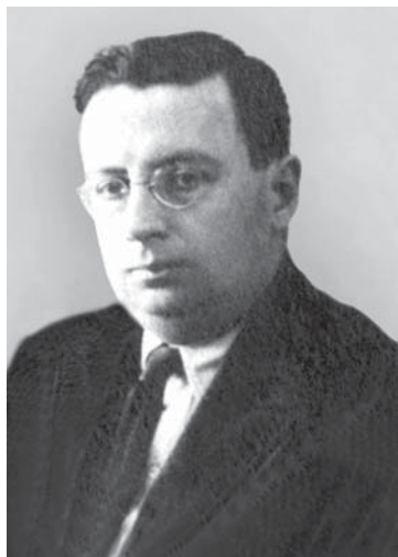
Проф. В. М. Штейн (1890–1964), более пяти лет провел в тюрьме и лагерях