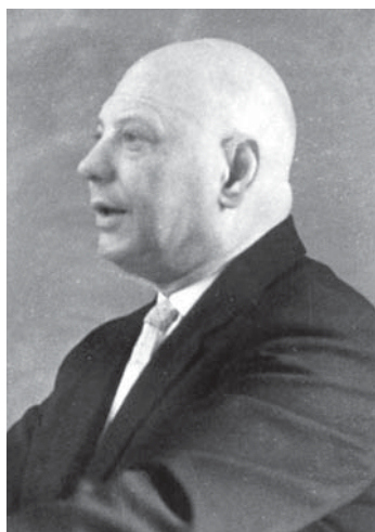
Проф. С. И. Тюльпанов (1901–1984), проректор ЛГУ, зав. кафедрой современного капитализма, разгромленной сталинистами в 1969 г.