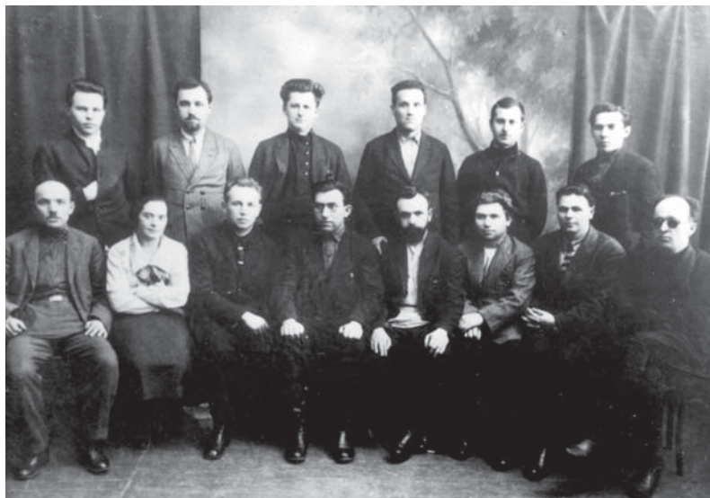
Н. А. Вознесенский в группе товарищей по партийной работе в Донбассе – первый слева во втором ряду (1927)