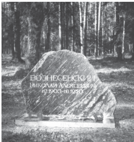
Памятный камень на мемориальном кладбище «Левашовская пустошь», где было захоронено тело растреляного Н. А. Вознесенского вместе с другими жертвами «Ленинградского дела». Установлен его семьей (1998)