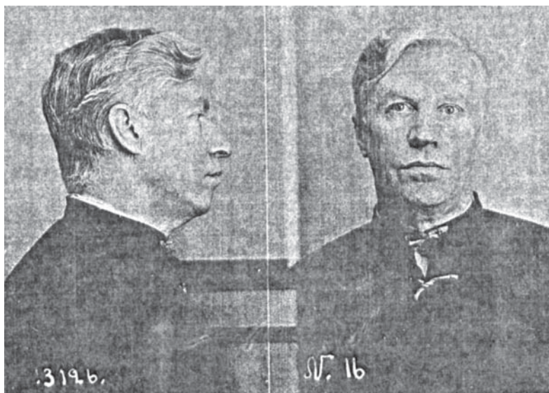
А. А. Вознесенский после ареста. Уже в арестантской одежде (1949)