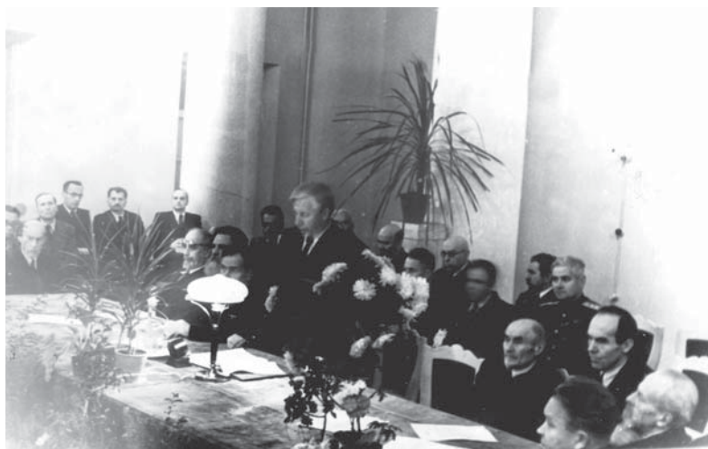
А. А. Вознесенский выступает на торжественном заседании Ученого совета ЛГУ, посвященного его 50-летию (1948)