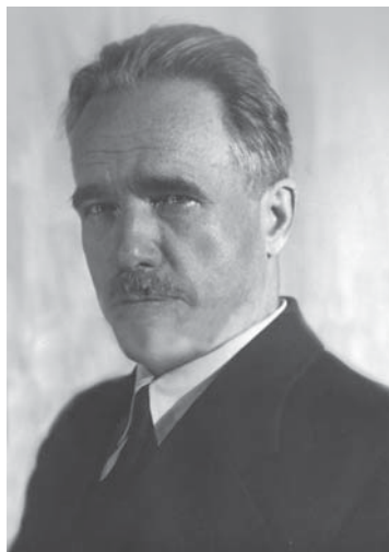
Проф. А. И. Буковецкий (1881–1972), более пяти лет провел в тюрьме и лагерях