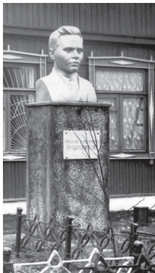
Бюст Н. А. Вознесенского в Черни у здания музея его имени