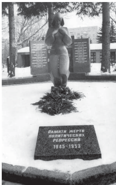
Донское кладбище в Москве. Мемориал в память жертв политических репрессий в 1945–1953 гг.