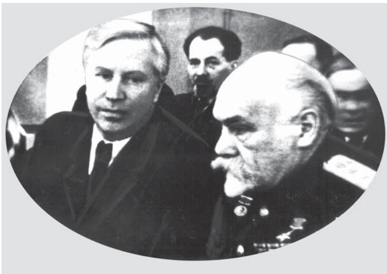
А. А. Вознесенский и акад. Л. А. Орбели на сессии Верховного Совета СССР (1947)