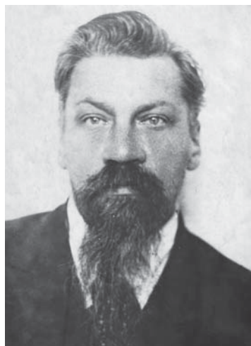
Проф. Л. В. Некраш (1886 – 1949), умер во время допросов