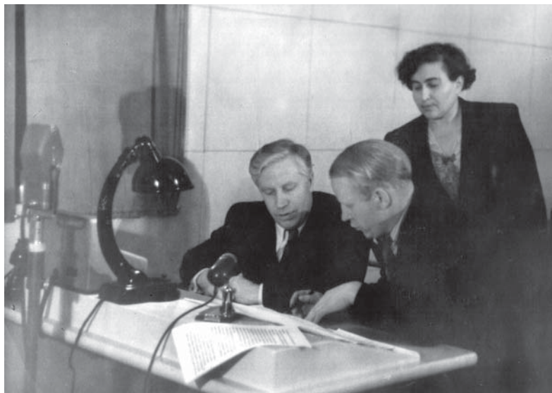
А.А. Вознесенский – министр образования РСФСР – готовится выступить по Всероссийскому радио 20 апреля 1948 г.