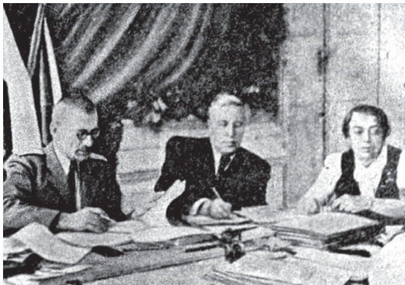
А. А. Вознесенский (в центре) вице-председатель Общеславянского комитета в Варшаве на его пленуме (1948)