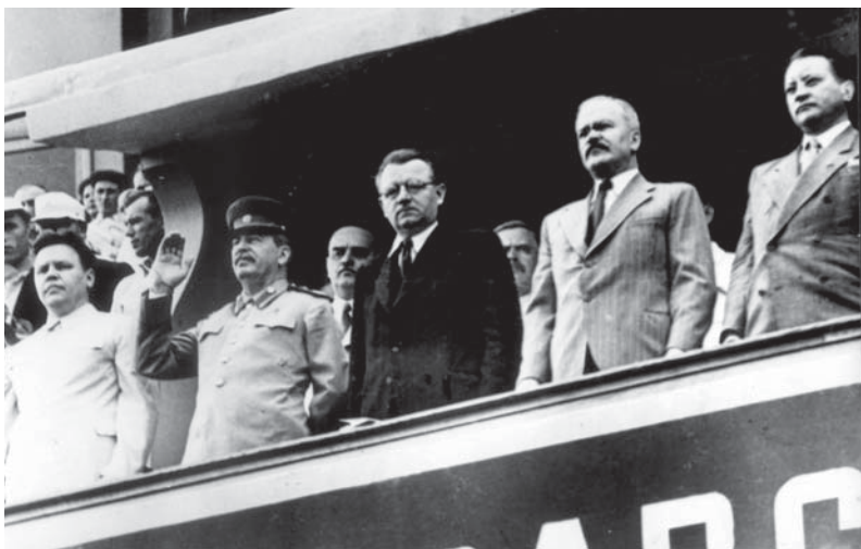
Н. А. Вознесенский на воздушном параде в Тушино. Слева: И.В. Сталин, К. Готвальд, В.М. Молотов (1948)