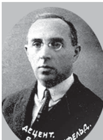
Проф. Я. С. Розенфельд (1883 – 1973), более пяти лет провел в тюрьме и лагерях