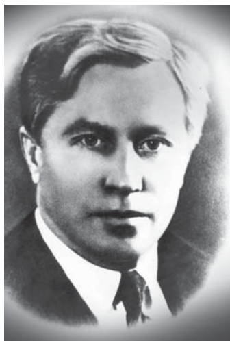
А. А. Вознесенский (1938?)