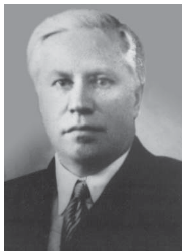
А.А. Вознесенский (1946)