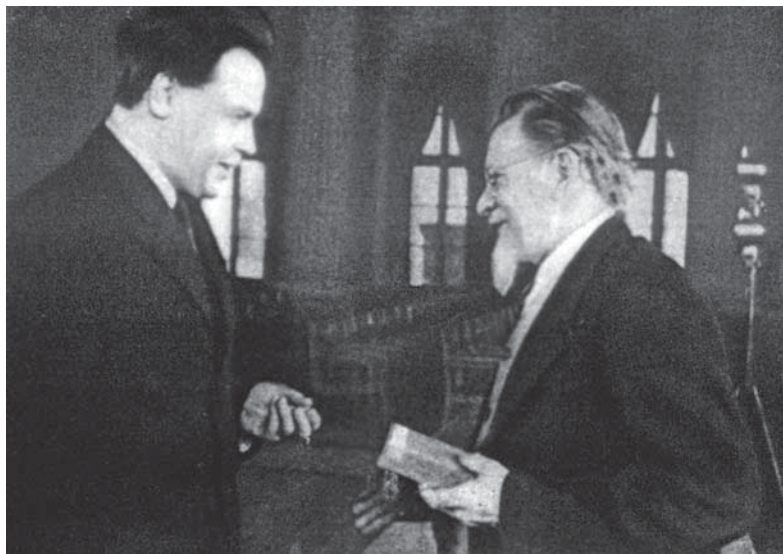
М. И. Калинин вручает председателю Госплана СССР Н. А. Вознесенскому первый орден Ленина (февраль 1941)