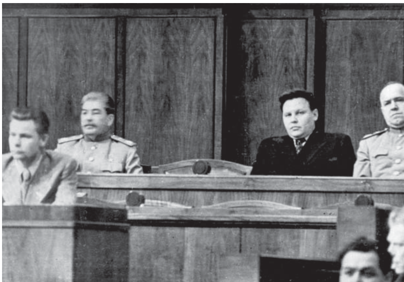
Н. А. Вознесенский на сессии Верховного Совета Союза ССР. Слева И. В. Сталин, справа К. Г. Жуков (1946)