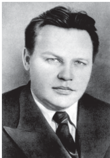
Н. А. Вознесенский (1945)