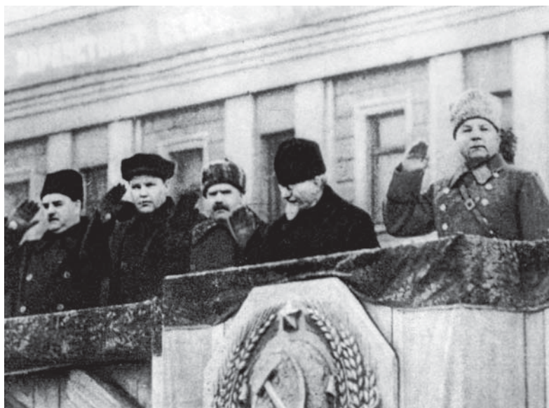
Н. А. Вознесенский, как Первый заместитель Председателя СНК СССР, представляет правительство на чествовании годовщины революции – второй слева (ноябрь 1941)