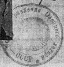
Справка об освобождении Ф.Ф. Визнера. (Личный архив Е.Ф. Визнера)