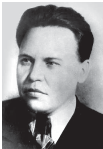
Н. А. Вознесенский (1948)